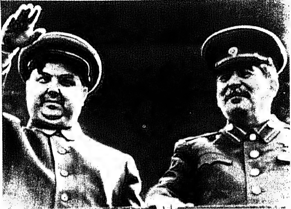
القائد والخليفة: ستالين وإلى جانبه مالينكوف على شرفة الكرملين عام ١٩٤٩.